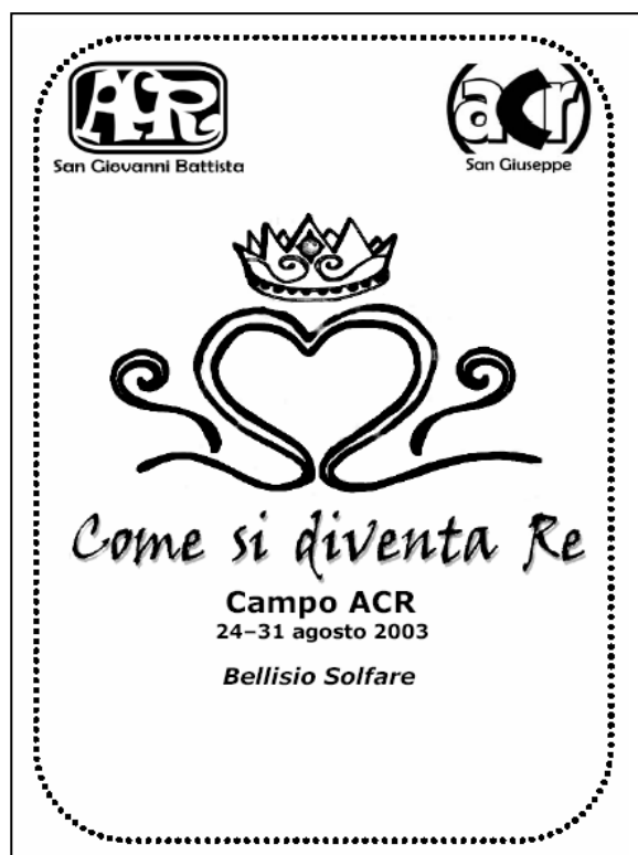
Copertina di presentazione del libretto del campo; è di aiuto lungo l'evolversi delle vicende della storia. Strumento fondamentale delle attività