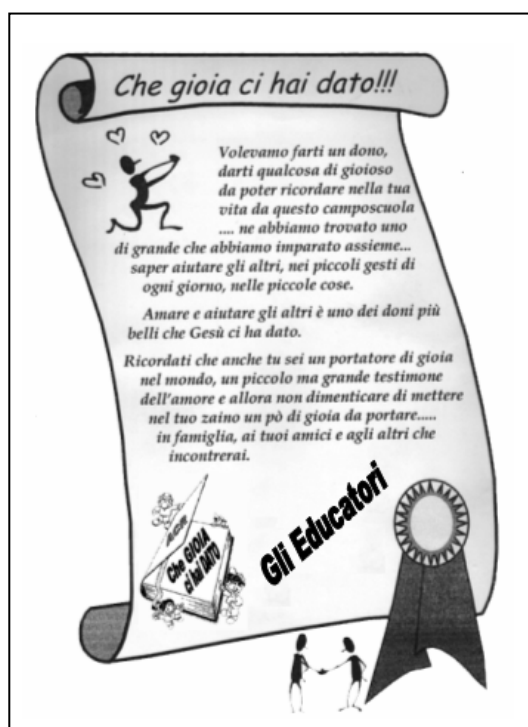
Attestato simbolico consegnato ai ragazzi a fine campo